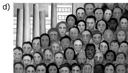
Tarsila do Amaral